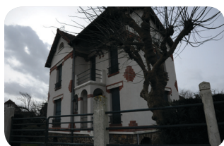
RUE DE LA PAIX

PARKINGS étude de la possibilité de nouveaux parkings souterrains libérant la circulation piétonnière et cycliste. Installation de parkings à vélo en centre-ville.