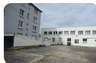
TADY Plus de 600 000 € pour y loger le siège d'une association et le char du carnaval