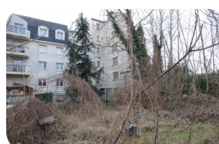
ZAC GARE 30 000 m 2 , Une friche, 19 ans d'échecs.

Isolation déplorable en particulier des portes et fenêtres.